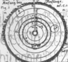
Das Dodekaeder & Sechseck oder Anfang der Anfänge. ad. c. 134. No. 1