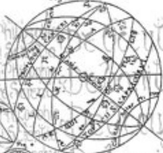
Fig. 2 ad. CW. 8. 3.